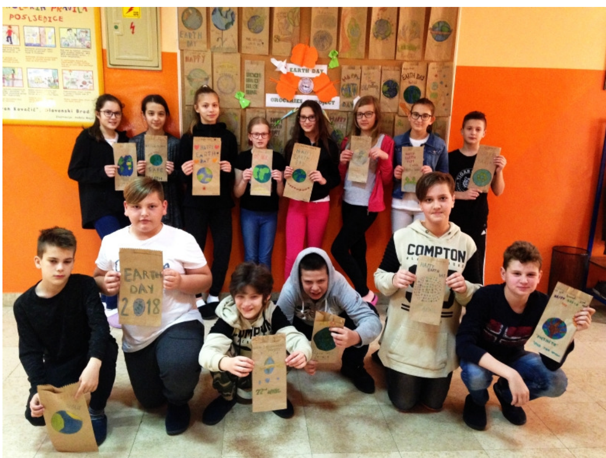
Učenci 5.a razreda sa dekoriranim papirnatim vrećicama.