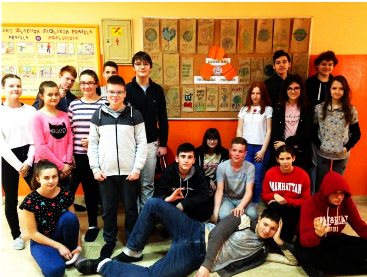
Učenci 8. b razreda sudjelovali su u projektu ekološkim istraživanjima.